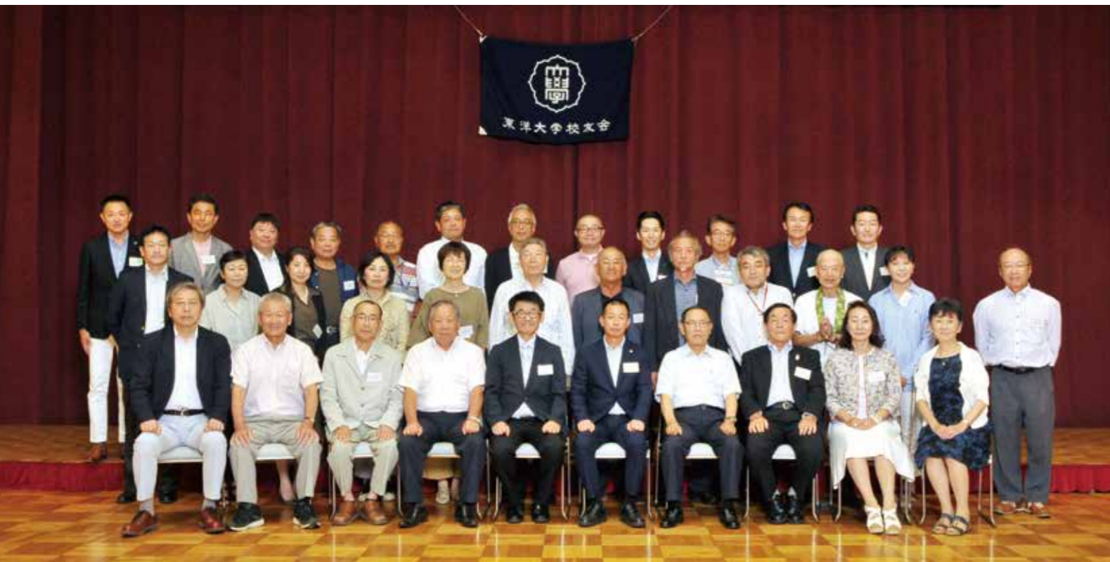
東洋大学校友会富山県支部総会 令和元年7月21日 パレブラン高志会館