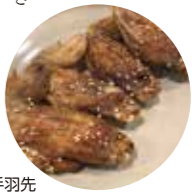
一番鳥名物の手羽先