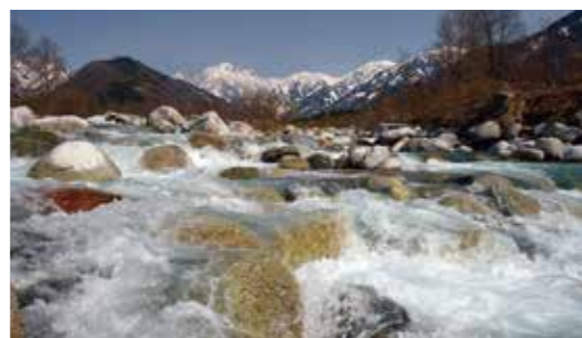
剣岳 撮影地：上市町(昭和46年画)