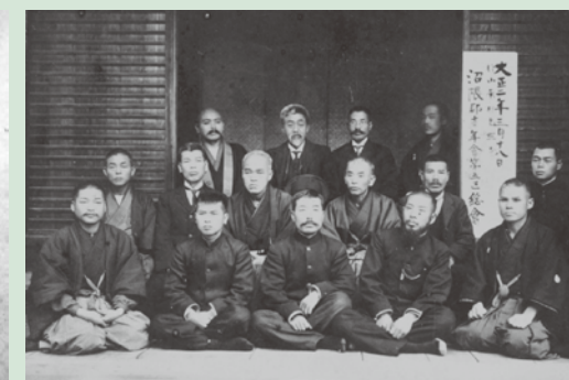
広島県沼隈郡にて、大正2(1913)年