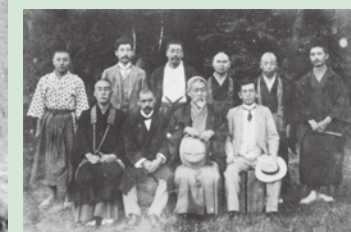
秋田県北秋田郡にて、大正4(1915)年