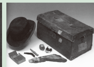
円了が使用した旅行鞆、帽子等