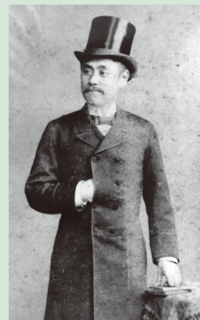
In Berlin, 1889