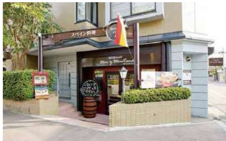
「スペイン料理店マルモンターニャ」 函館市松陰町31番13号1階 電話0138-83-5993