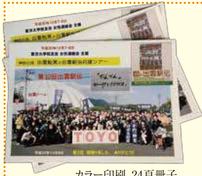
カラー印刷、24頁冊子