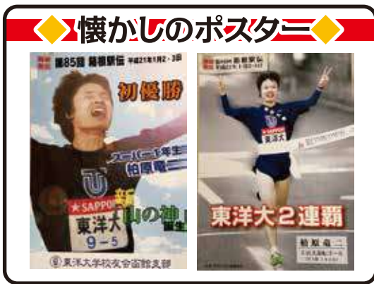
函館支部で制作したものです