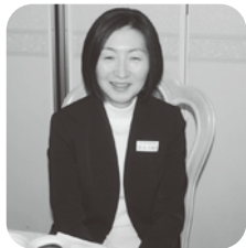
令和2年2月15日 函館支部新年会

桜の季節が終わろうとしていた東京から生まれ育った函館へ戻ったのは、一昨年の四月でした。