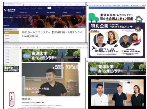
東洋大学 HP (ホームカミングデー Web 開催案内)

談、③卒業生アスリート対談/指導者対談、④各キャンパスの思い出探訪、⑤オンラインゼミ交流会の各企画が用意され、令和2(2020)年10月25日(日)の午前10時から午後5時まで、オンライン参加(一部Web登録)で行われました。私も、動画配信の「特別企画(卒業生アスリート対談、指導者対談)」「キャンパスの思い出探訪」などを閲覧させていただきました(画像参照)。(文責:黒井登起雄)