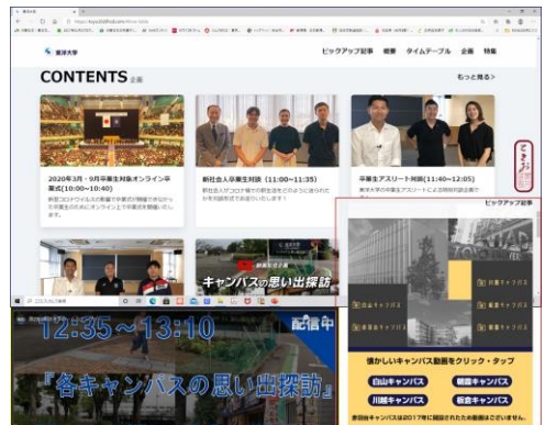
東洋大学 HP (ホームカミングデー2020, Web 開催)

埼玉県東部支部校友会の皆様「今、取組んでいること」「私の取組んできたこと」などの原稿を写真とともに下記アドレスまでお寄せ下さい! アドレス saita_east@yahoo.co.jp