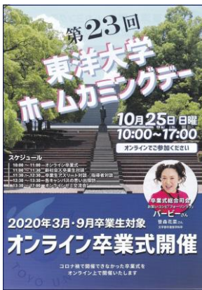
東洋大学ホームカミングデー案内パンフレット (Web 開催)

校友会本部の『令和2年(2020) 校友大会』は、新型コロナウイルス禍のために開催が中止になりました。また、東洋大学(社会連携推進室)主催の令和2年度『第23回東洋大学ホームカミングデー』は、コロナ過のために、全企画がオンライン開催となりました。企画は、①オンライン卒業式、②新社会人卒業生対