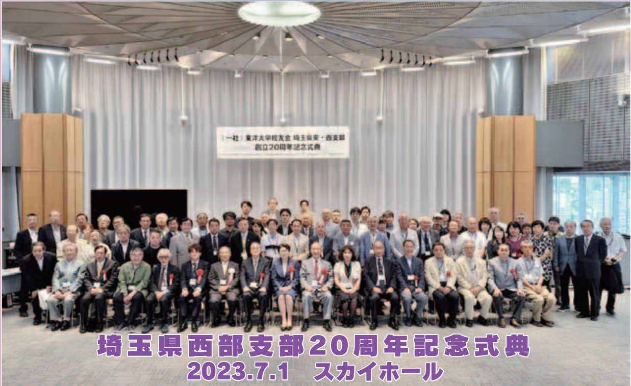
埼玉県西部支部20周年記念式典 2023.7.1 スカイホール