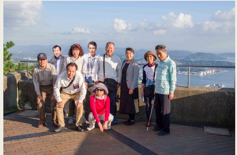
佐世保市内一望できる弓張岳展望台にて