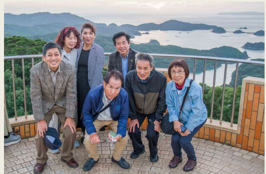
展海峰にて海に沈む夕日を観察（あいにく少し曇り空）