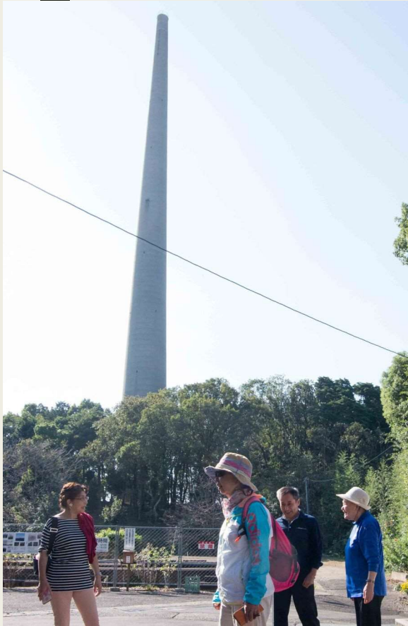
10/17 朝一で国指定重要文化財の 「針尾無線塔」へ