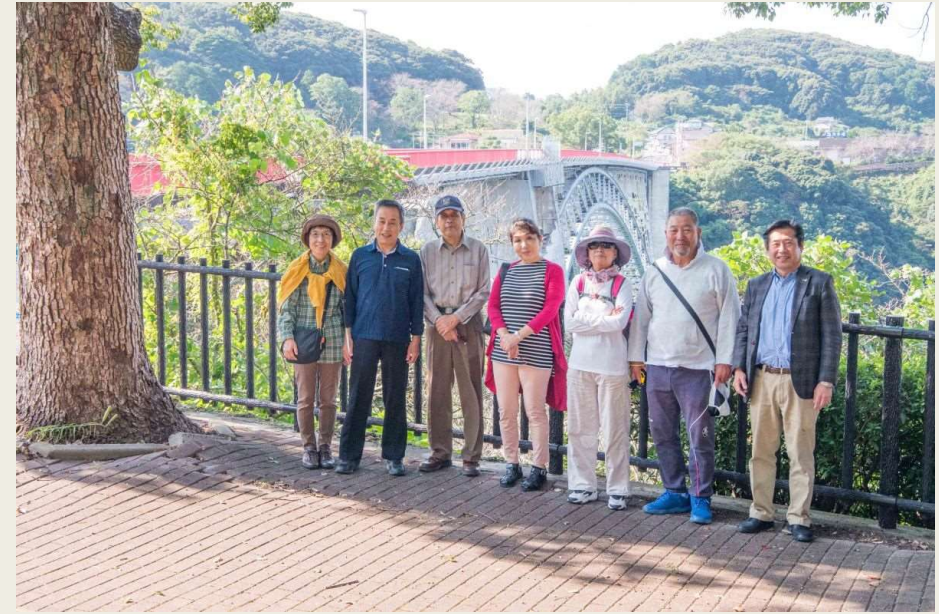
渦潮の瀬戸にかかるアーチ橋 国指定重要文化財「西海橋」