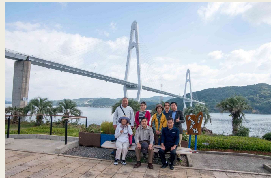
長さ1095mの斜張橋「大島大橋」を渡り大島へ