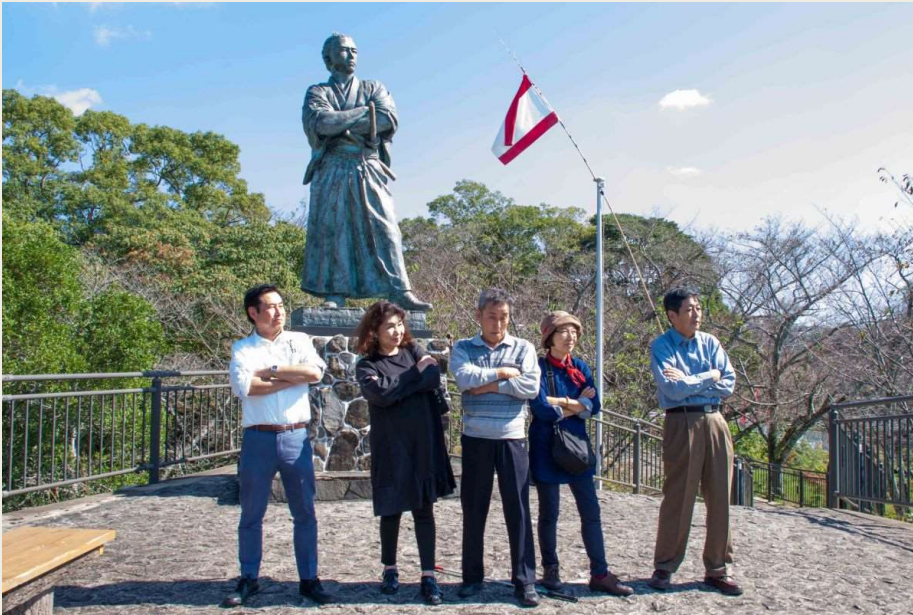
風頭公園 坂本龍馬像の前でポーズ