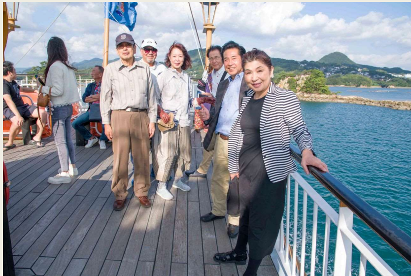
10/16 佐世保入り 西海国立公園九十九島を遊覧