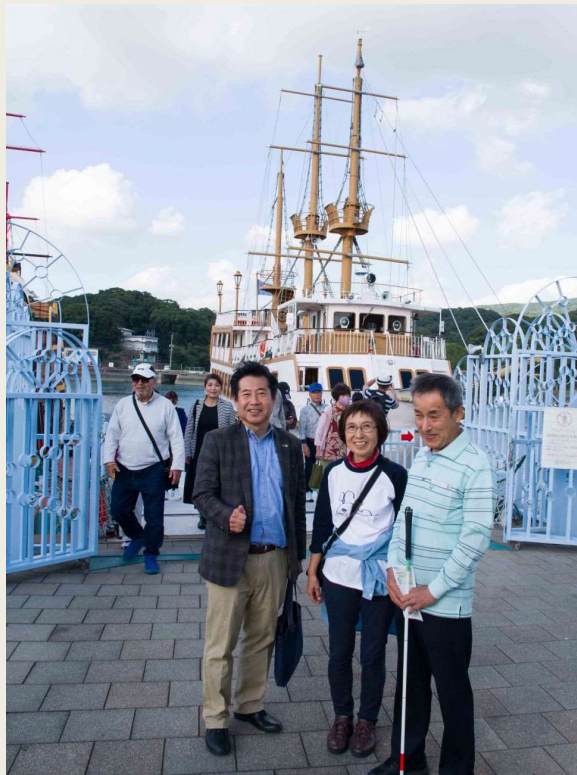
観光船 船着き場にて