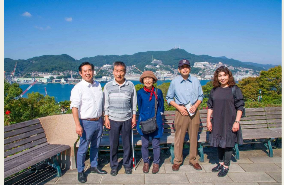
10/18 南山手から長崎港をバックに記念撮影