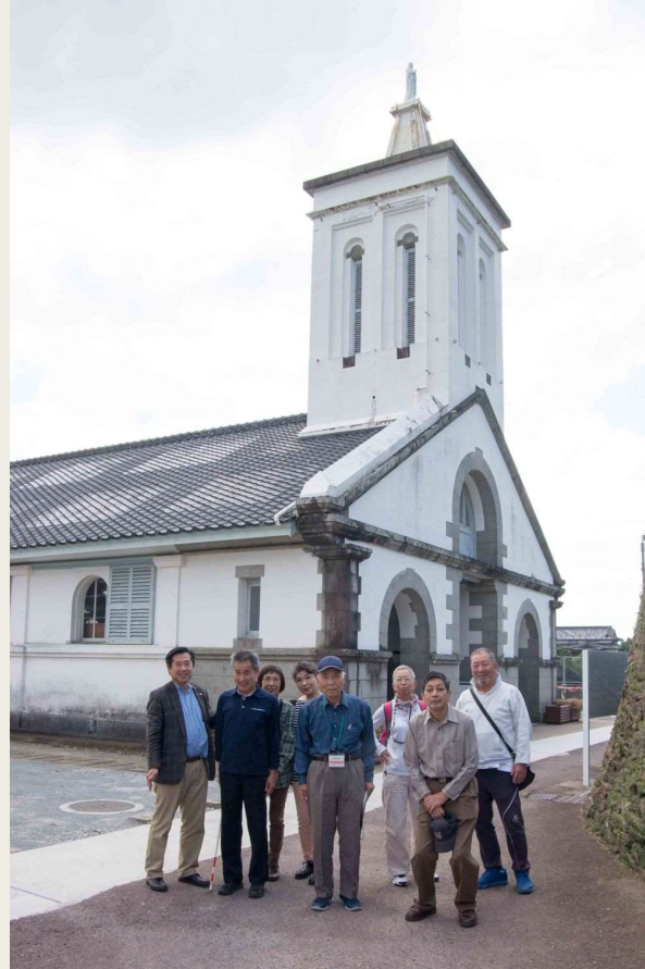
世界遺産志津教会