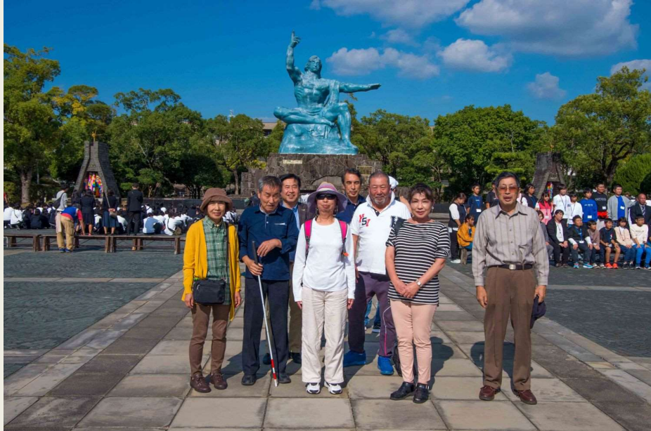
長崎市平和公園 平和記念像前 外国人や修学旅行生がいっぱいました