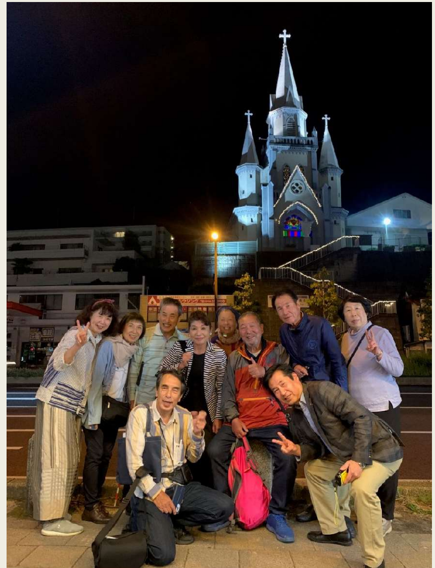
懇親会終了後 カトリック三浦教会前で記念撮影