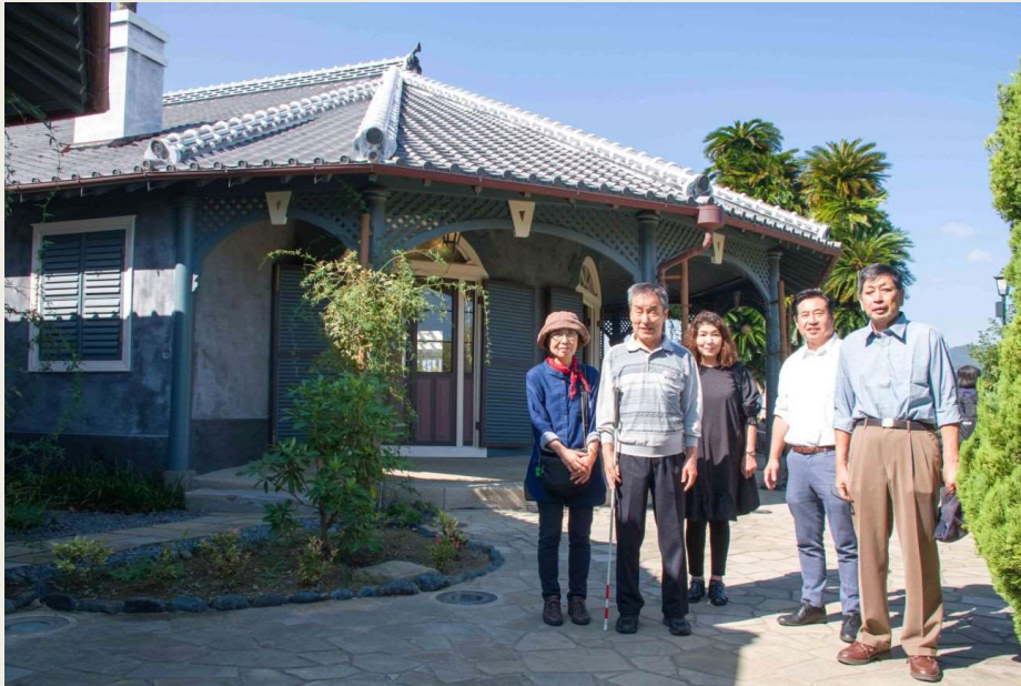
歴史建造物 グラバー園にて