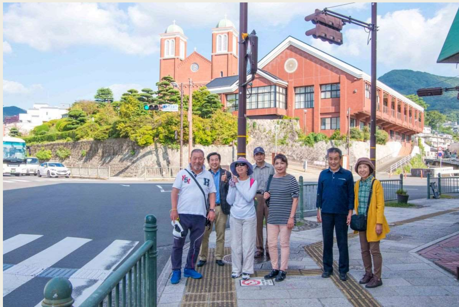
被爆建物 浦上天主堂