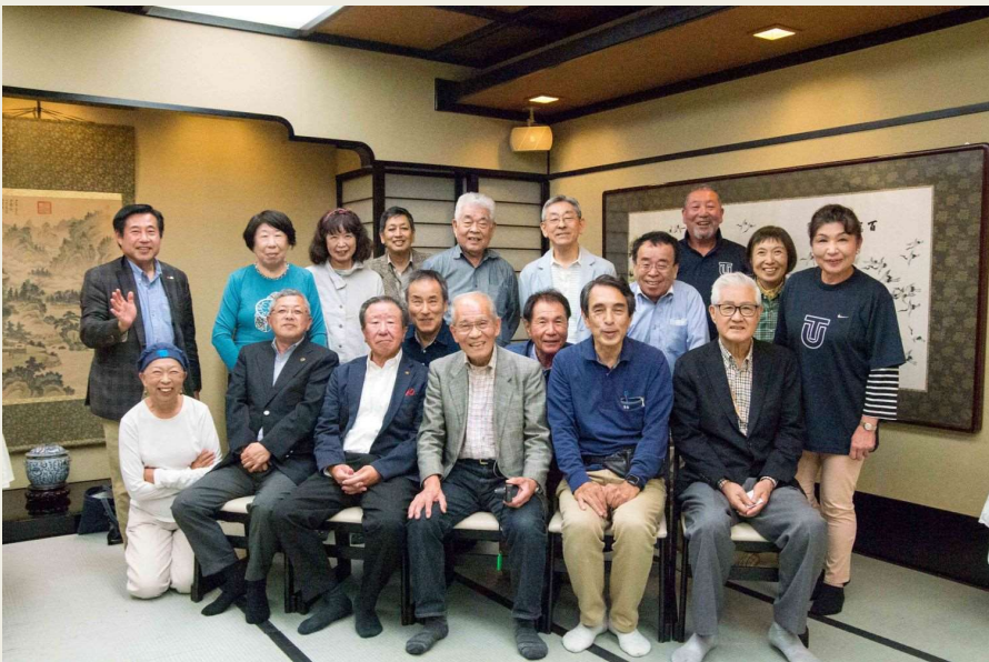
長崎市新地中華街「会楽園」にて 中華コース料理をいただきました 18名